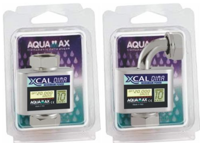
Confezione | Packaging

The XCAL DIMA and DIMA L magnetic descalers are suitable for use with all boilers. Fixing is directly by means of a threaded connecting ferrule (AQUAMAX patent pending) that facilitates the installation even in particularly reduced space situations.